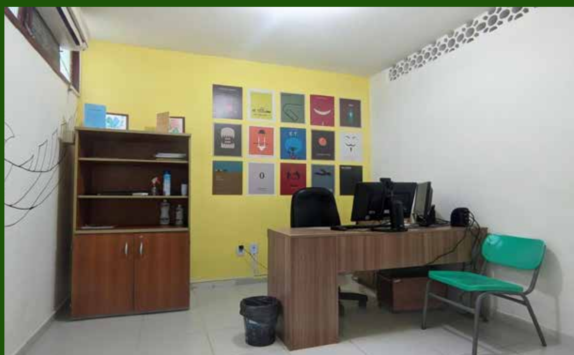
Foto 6: sala da Coordenação de Relações Institucionais, Comunicação e Eventos

Medindo o equivalente a 19 m 2 , a Coordenação de Comunicação Institucional é responsável pela interação com as instituições governamentais e privadas, buscando parcerias para a colaboração com o desenvolvimento regional.