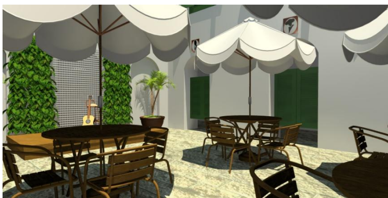
Figura 1 - Café na parte descoberta