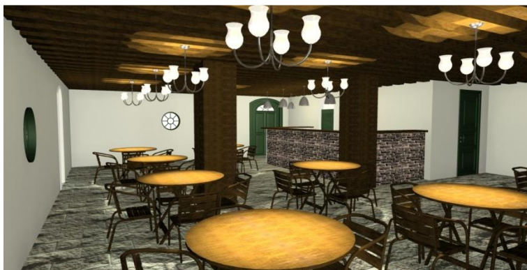
Figura 3 - Café na área interna