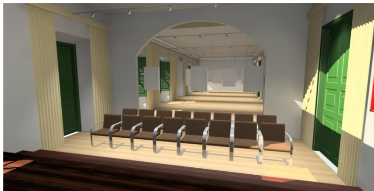
Figura 6 - Sala de Exposições Temporária