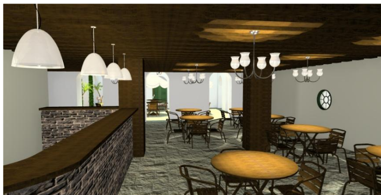
Figura 4 - Café na área interna