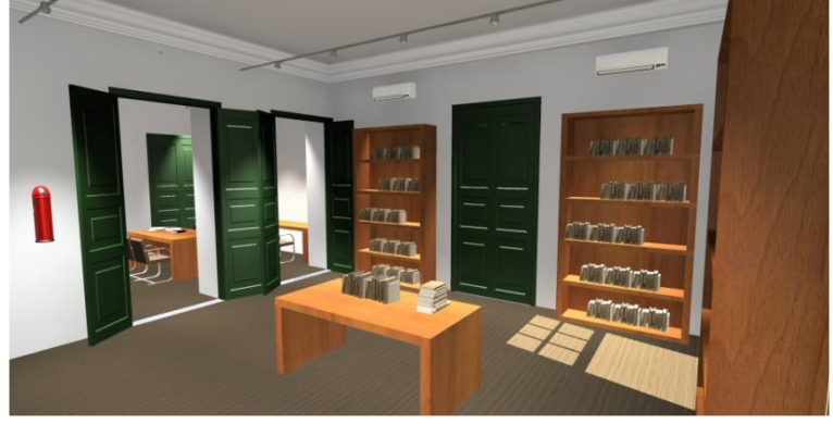
Figura 7 – Sala de Leitura