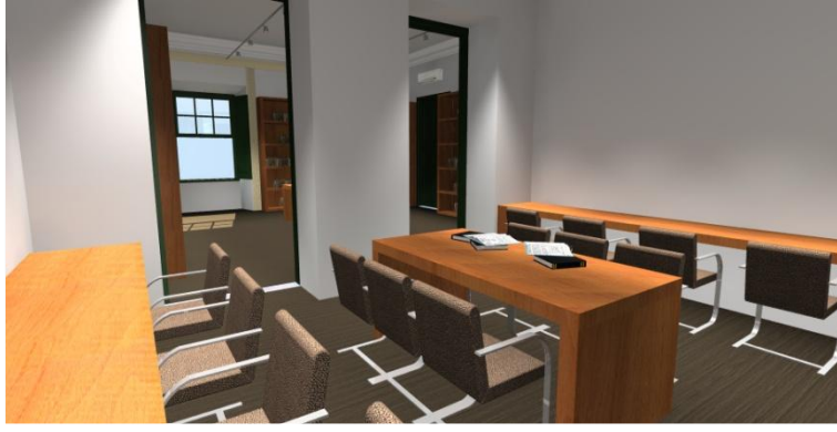
Figura 7 – Sala de Estudo