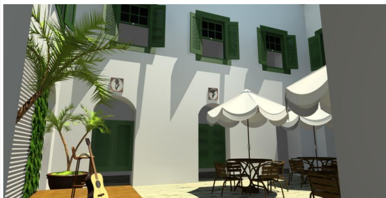
Figura 2 - Café na parte descoberta